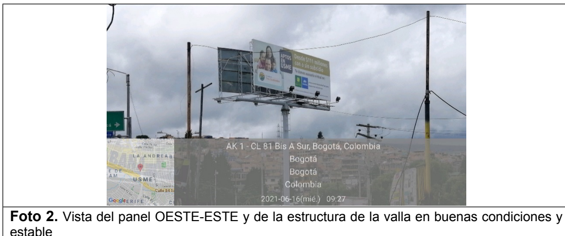
Foto 2. Vista del panel OESTE-ESTE y de la estructura de la valla en buenas condiciones y estable